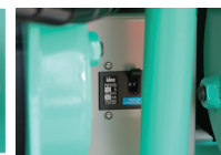
② ブレーカースイッチ